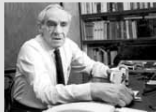
Зиновий Ефимович Гердт

Советский и российский актер театра и кино, народный артист СССР. Зиновий Ефимович участник Великой Отечественной войны. 12 февраля 1943 года, на подступах к Харькову, при разминировании минных полей противника для прохода советских танков, он был тяжело ранен в ногу осколком танкового снаряда. После одиннадцати операций, Гердту сохранили поврежденную ногу, которая с тех пор была на 8 сантиметров короче здоровой и вынуждала артиста сильно прихрамывать. Даже просто ходить ему было трудно, но актер не давал слабину и не щадил себя на съёмочной площадке.