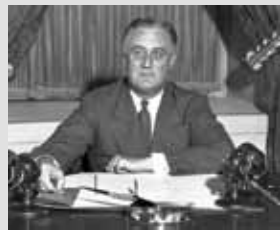
Франклин Делано Рузвельт

Пожалуй, самый известный президент США, который в 1921 году очень тяжело переболел полиомиелитом. Он изо всех сил старался бороться с болезнью, но все же очутился в инвалидном кресле. Однако это не помешало ему войти в мировую историю своими заслугами. С его именем ассоциируются такие важнейшие события, как борьба против гитлеровской коалиции во времена Второй мировой войны и существенная нормализация международных дипломатических отношений с Советским Союзом.