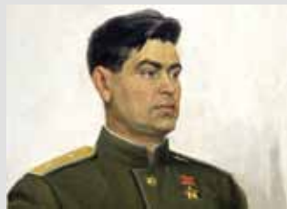
Алексей Петрович Маресьев

легендарный летчик, Герой Советского Союза. 4 апреля 1942 года в бою с немцами самолет Алексея Маресьева был подбит, а сам Алексей тяжело ранен. Восемнадцать суток раненый в ноги летчик ползком пробирался к линии фронта. В госпитале ему ампутировали обе ноги. Но он, выписавшись из больницы, снова сел за штурвал самолета. Всего за время войны совершил 86 боевых вылетов, сбил 11 самолетов врага: четыре до ранения и семь - после ранения. Алексей Маресьев стал прототипом героя повести Бориса Полевых «Повесть о настоящем человеке».